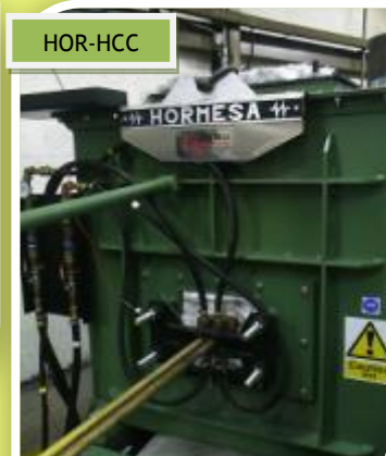
COLADA CONTINUA HORIZONTAL