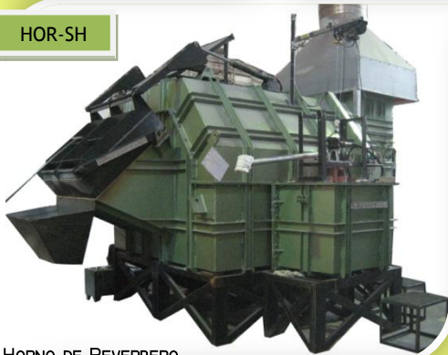
HORNO DE REVERBERO