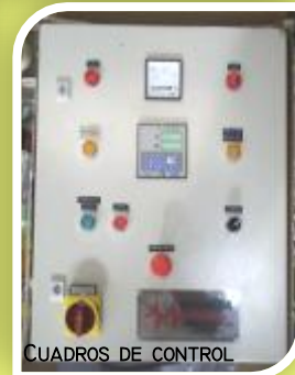
CUADROS DE CONTROL