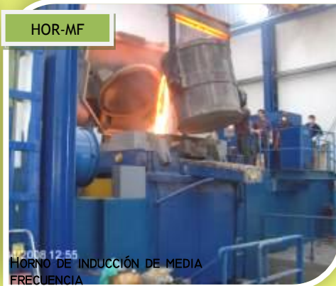
HORNO DE INDUCCIÓN DE MEDIA FRECUENCIA