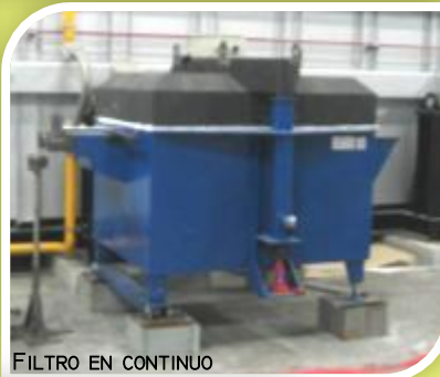
FILTRO EN CONTINUO