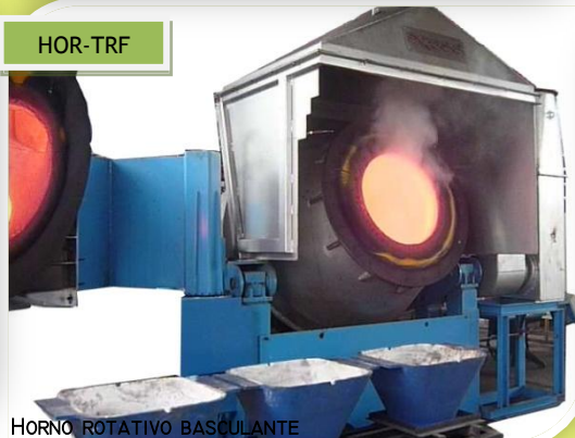
HORNO ROTATIVO BASCULANTE