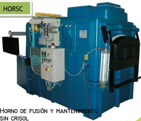
HORNO DE FUSIÓN Y MANTENIMIENTO SIN CRISOL