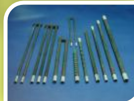
RESISTENCIAS DE SIC

LAS MARINERAS, 13E-28.864 AJALVIR-MADRID-ESPAÑA