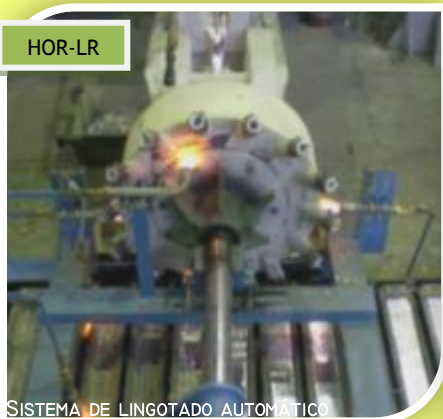
SISTEMA DE LINGOTADO AUTOMÁTICO