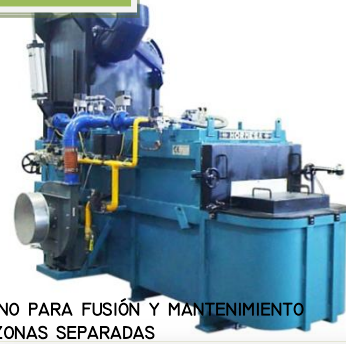
HORNO PARA FUSIÓN Y MANTENIMIENTO EN ZONAS SEPARADAS