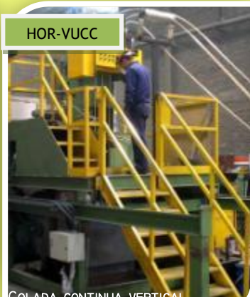
COLADA CONTINUA VERTICAL ASCENDENTE