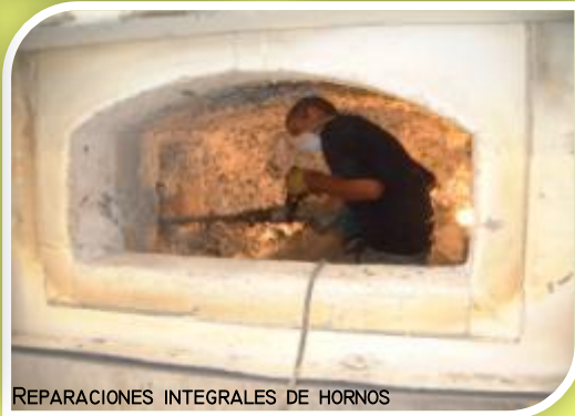
REPARACIONES INTEGRALES DE HORNOS