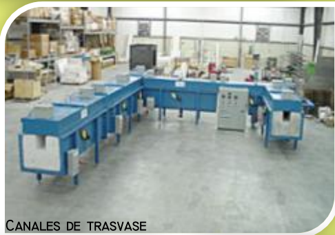
CANALES DE TRASVASE