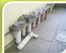
TUBOS DE DOSIFICACIÓN