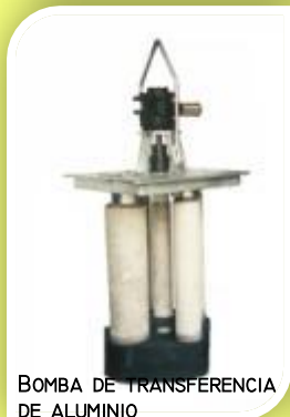
BOMBA DE TRANSFERENCIA DE ALUMINIO