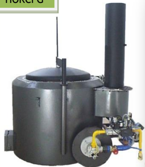
HORNO DE CRISOL FIJO A GAS