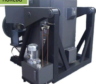
HORNO DE CRISOL BASCULANTE A GAS