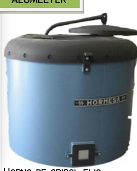
HORNO DE CRISOL FIJO CON RESISTENCIAS