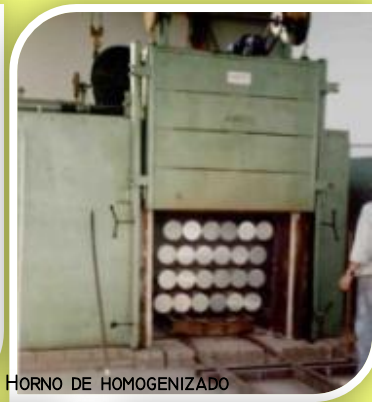
HORNO DE HOMOGENIZADO