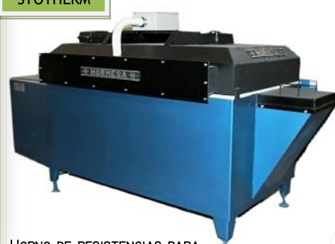
HORNO DE RESISTENCIAS PARA MANTENIMIENTO DE ALUMINIO