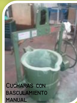
CUCHARAS CON BASCULAMIENTO MANUAL