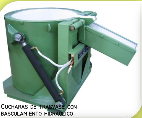
CUCHARAS DE TRASVASE CON BASCULAMIENTO HIDRAULICO